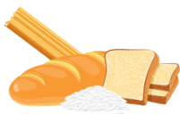
ХЛЕБ, ЗЛАКИ, МАКАРОНЫ И РИС