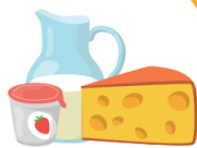
МОЛОКО, ЙОГУРТ И СЫР