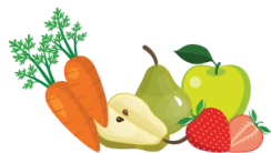
ФРУКТЫ И ОВОЩИ